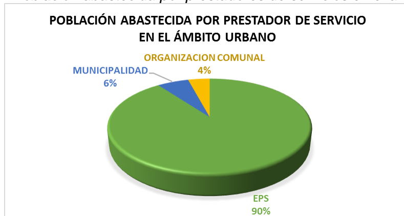
Grafico 02: Población abastecida por prestadores de servicios en el ámbito urbano

En el Gráfico 02, se evidencia que en el ámbito urbano el 90% de la población abastecida es atendida por la EPS SEDAPAR. En una menor proporción encontramos a las Municipalidades y Organizaciones comunales con un 6% y 4% respectivamente.