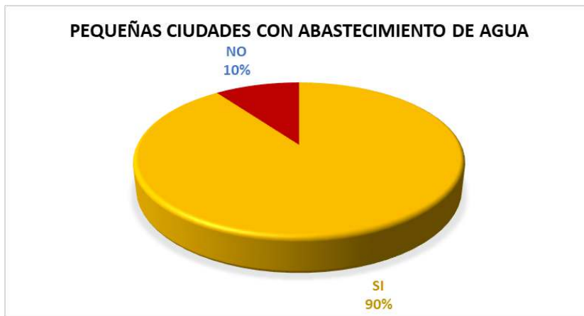
Gráfico 01: Pequeñas Ciudades con abastecimiento de agua (**)

En el grafico 01. se muestra que el 90% de las pequeñas ciudades cuentan con el servicio de “Abastecimiento de Agua” en la region.