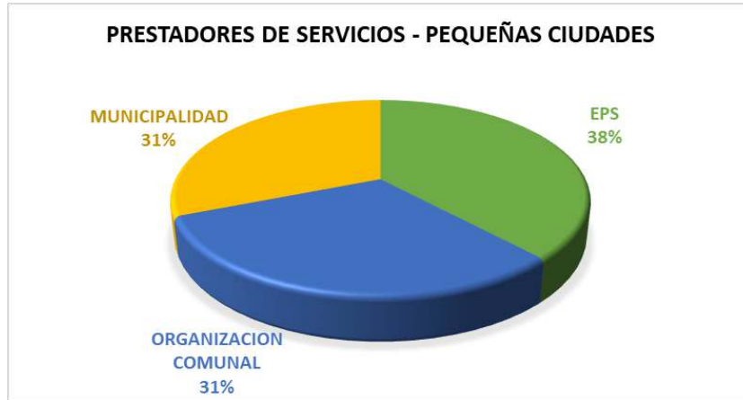
Gráfico 02: Prestadores de servicios en Pequeñas Ciudades (**)

En el grafico 02. se muestra que el 38% de los sistemas de abastecimiento de agua en las pequeñas ciudades estan a cargo de la EPS Sedapar, seguido por OCSAS y Municipalidades, ambas con un 31%.